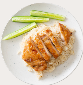
Pollo con arroz al mediodía