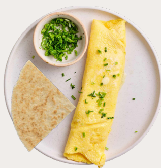
Un omelette y casabe en la mañana

No necesitas platos diferentes cada día. Puedes usar los mismos alimentos y cambiar las combinaciones: