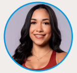
Por Genesis Merette , fitness coach @genesismerette

Empieza poco a poco: No intentes preparar toda la semana de una vez. Lo ideal es comenzar con 3 a 5 días de comidas. Así evitas sentirte abrumada y mantienes la comida fresca.