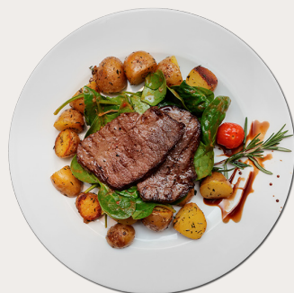
Atún o carne con papa horneadas en la noche